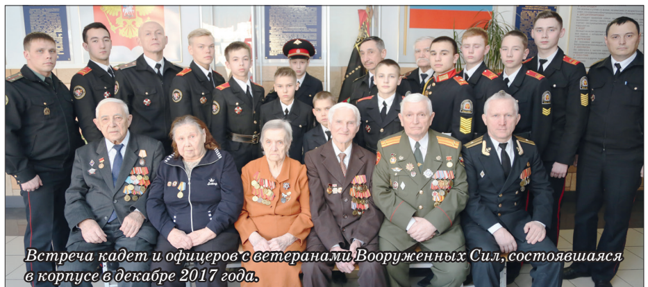
Встреча кадет и офицеров с ветеранами Вооруженных Сил, состоявшаяся в корпусе в декабре 2017 года.